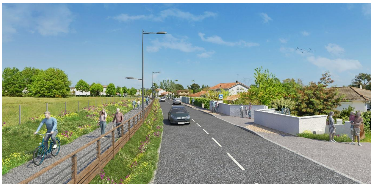
AMBARÈS-ET-LAGRAVE_AMENAGEMENT DE LA RUE CARBON BLANC

À la suite des travaux réalisés sur le giratoire de l'Europe et la rue de Carbon Blanc à Ambarès et Lagrave , le chantier évolue et se poursuit rue de Carbon Blanc, dans le cadre du programme d'aménagement et de requalification mené par Bordeaux Métropole.