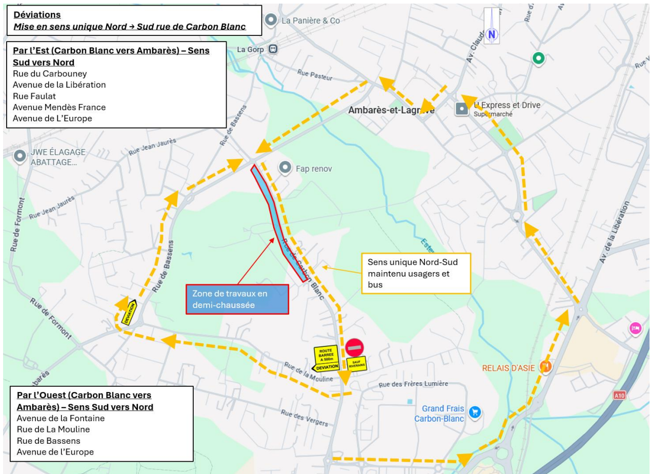
Déviations pendant la mise en sens unique Nord → Sud rue de Carbon Blanc

La déviation des véhicules s'organisera de la façon suivante :