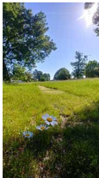
Esplanade du collège