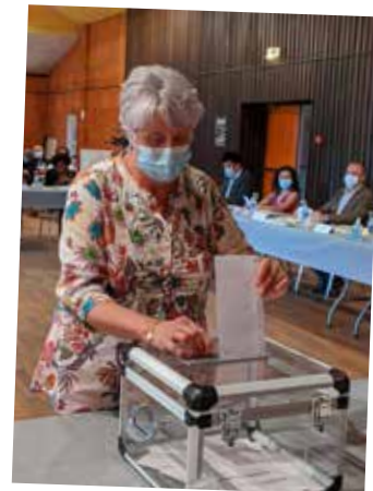
Le Maire et les 7 adjoints ont été élus par le Conseil municipal à bulletin secret.

Alors mettons-nous au travail. Vive Carbon-Blanc. Vive la République.