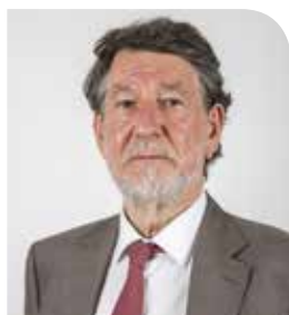
Alain ANZIANI, Maire de Mérignac Président de Bordeaux Métropole

Depuis 1977, la Métropole fonctionnait sur un mode de cogestion entre les différents groupes politiques. Aujourd'hui, une nouvelle gouvernance, reposant sur un pilotage majoritaire, est actée.