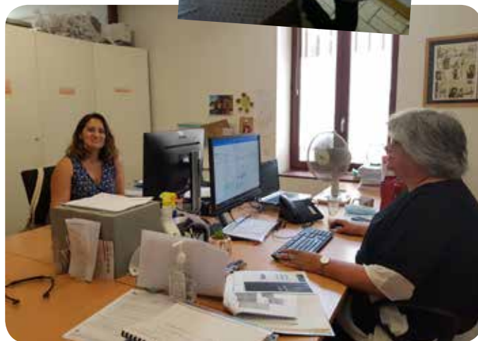
Merci à la société Sogeres de leur appui au portage des repas