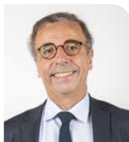
Pierre HURMIC, Maire de Bordeaux 1 er Vice-président en charge du pilotage et évaluation du projet de transition métropolitain