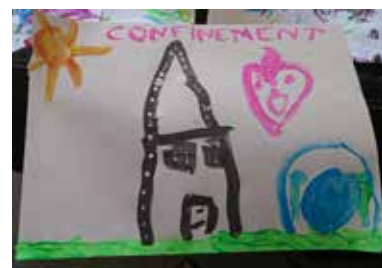
Concours de dessin : Lola Mollet

Défi Incroyable Talent : Victoire Hamm Smaer avec un magnifique Stop Motion réalisé avec des Playmobil, scolarisée au collège de Carbon Blanc en 6 ème .