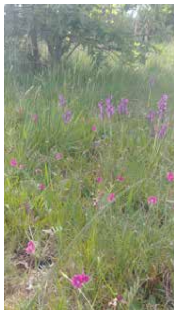
Orchis bouffon - Plaine du Faisan