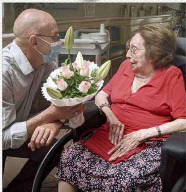
BON ANNIVERSAIRE 101 ANS RÉSIDENCE ABELIA