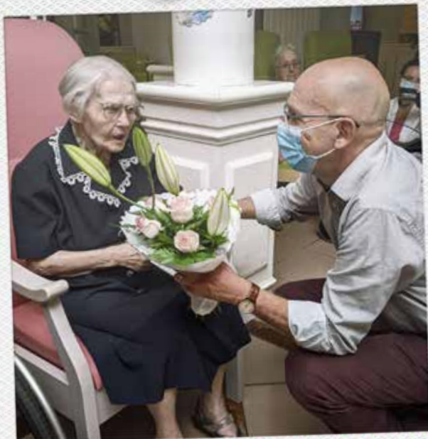
BON ANNIVERSAIRE 107 ANS RÉSIDENCE ABELIA