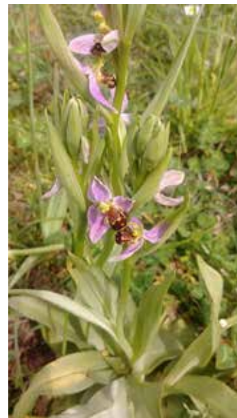
Ophrys abeille - Parc Favols