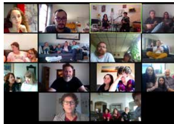
Un concert en visio avec le groupe Plum

differencesetpartages@gmail.com differencesetpartages.fr Sur Facebook et Instagram