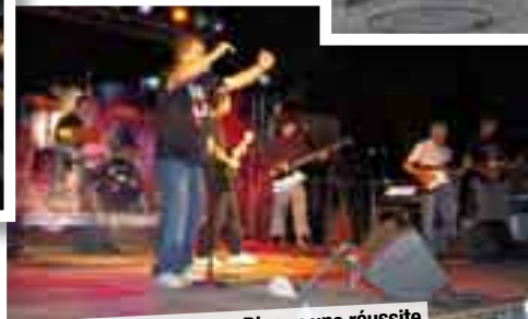
White Carbon's à Carbon-Blanc : une réussite