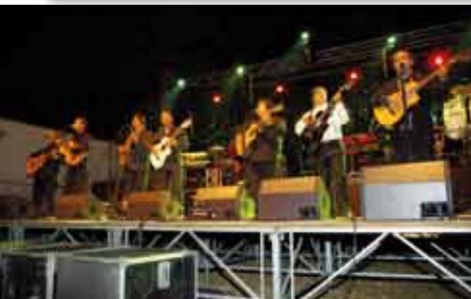
Chico & The Gypsies...