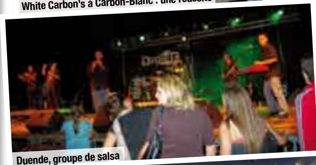
Duende, groupe de salsa