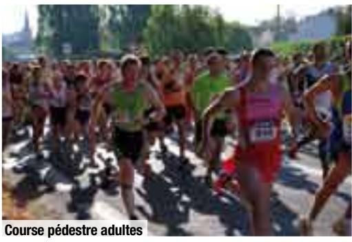
Course pédestre adultes

Retour sur Carbon-Blanc la fête 2010 : Cette année encore, le Comité des fêtes et loisirs soutenu par la municipalité, a mobilisé plus de 12 000 girondins du 2 au 5 septembre.