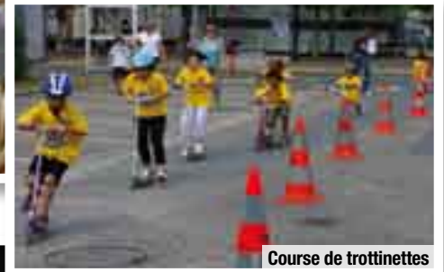
Course de trottinettes