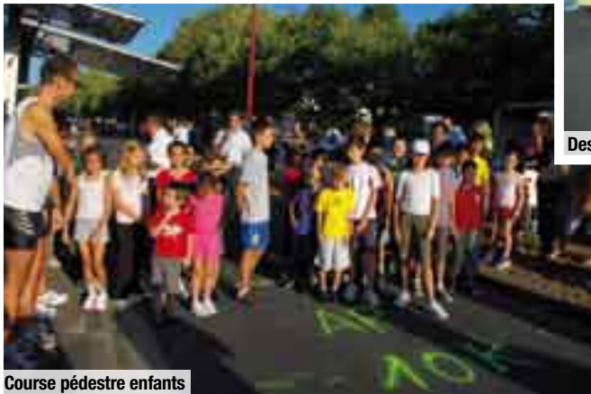
Course pédestre enfants