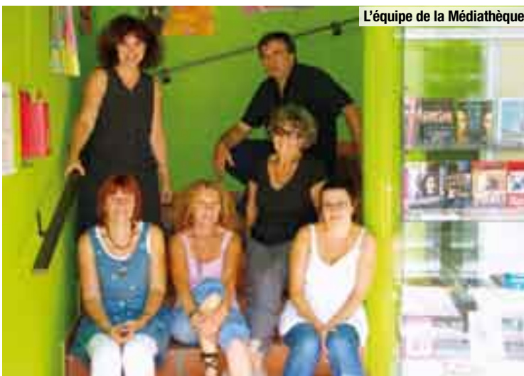
L'équipe de la Médiathèque