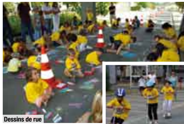
Dessins de rue